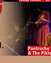
Pantruche Poulette & The Pickle Pickers